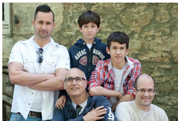
Vater mit vier Söhnen.

Den sehe ich als einen Teil der Stadtverwaltung, der ein hoffentlich nicht unerhebliches Stück Mehrwert generiert, dass die Wuppertalerinnen und Wuppertaler ihre Verwaltung als kundenorientierten Dienstleister wahrnehmen.