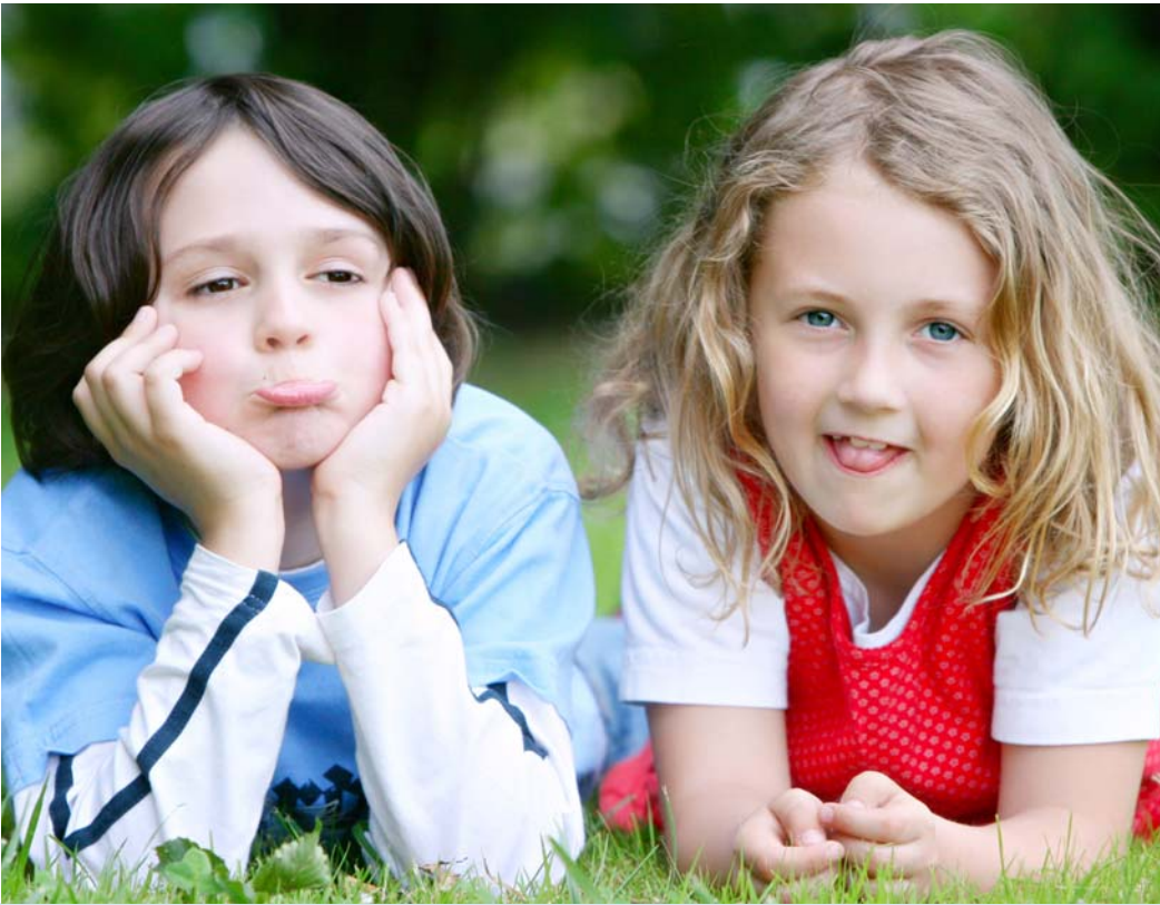
Gerade Kinder im Osten von Wuppertal brauchen noch mehr Betreuungsangebote.

In einem gemeinsamen Antrag haben die Fraktionen von SPD und CDU die Erweiterung der Grundstücksflächenprüfung für mögliche KiTa-Standorte für die Quartiere Wichlinghausen, Heckinghausen und Oberbarmen gefordert.