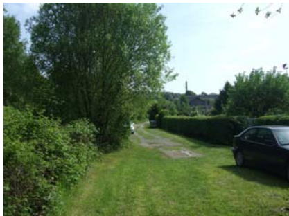
Verbindungsstück Tunnel S-Bahnhaltepunkt Langerfeld.