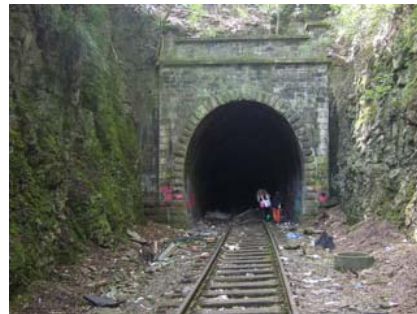
Tunnel zwischen Langerfeld und Wichlinghausen – Tunnelmund Dahler Str..