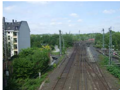
Blick von der Brücke Spitzenstraße.