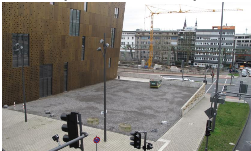
Gemäß der Rahmenverträge hätte neben der BV auch der Gestaltungsbeirat an der Gestaltung des Platzes östlich des Investorengebäudes beteiligt werden müssen.

Die Beschlussfassung zur Nutzung des Platzes östlich des Investorengebäudes am Döppersberg als zusätzlicher Taxenstellplatz wurde von der Verwaltung beanstandet. Auf Nachfrage unseres Stadtverordneten Thomas Kring, der auch Sprecher der SPD-Fraktion in der Bezirksvertretung (BV) Elberfeld ist, hat die Verwaltung mitgeteilt, dass die BV Elberfeld, und abschließend der Rat, sehr wohl hätten beteiligt werden müssen.