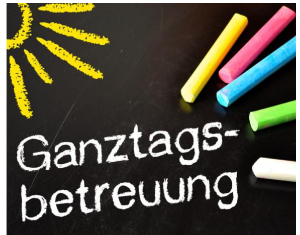
Die nächste Ausbauphase muss individuelle, kreative Erweiterungsmöglichkeiten finden.

finden, die augenscheinlich keine räumlichen Erweiterungsmöglichkeiten vorweisen können. Doch auch hier bin ich zuversichtlich, dass die Fachverwaltung Lösungen finden wird“, so Renate Warnecke abschließend.