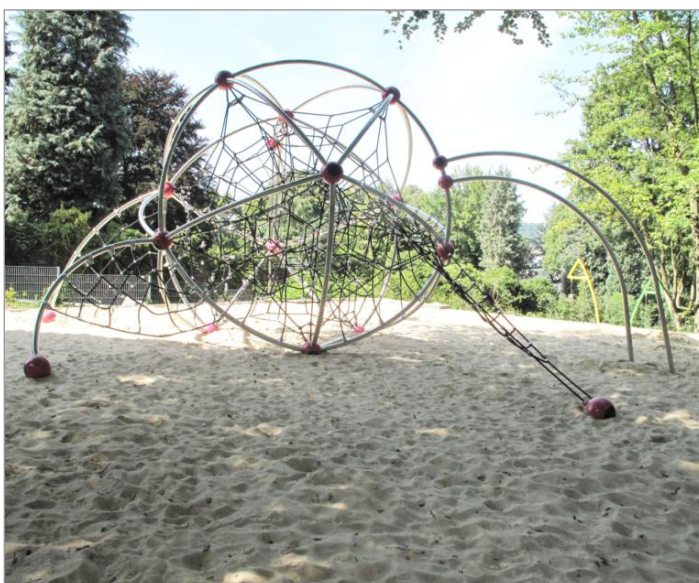
Diesmal profitieren Stadtteile, die nicht durch das Programm „Soziale Stadt“ gesondert gefördert werden.

„Es ist schön zu sehen, dass die Vorhabenliste trotz der angespannten finanziellen Situation sukzessive abgearbeitet wird. Sicherlich können wir keine großen Sprünge machen, und es gibt noch viel zu tun in Sachen Spielflächensanierung, aber es geht in die richtige Richtung. Perspektivisch ist noch eine weitere Sanierungsmaßnahme im Bezirk Wuppertal Ronsdorf vorgesehen. Sobald die KiTa am Mohrenhensfeld fertiggestellt ist, wird auch der dortige Spiel- und Bolzplatz in der Prioritätenliste ganz nach oben rutschen und als eine der nächsten Sanierungsmaßnahmen durchgeführt. Das sind gute Nachrichten für den Bezirk Rehsiepen“, erklärt Renate Warnecke abschließend.